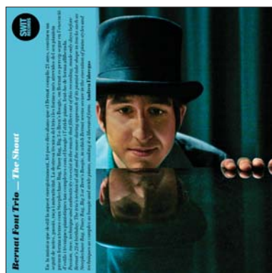
BERNAT FONT TRIO The Shout (Swit Records, 2010)