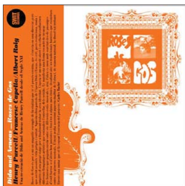
H. PURCELL - F. CAPELLA - A. ROIG Dido and Aeneas - Roses de Gos (Swit Records, 2009)