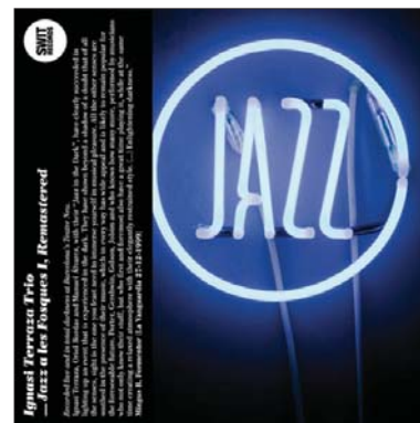
IGNASI TERRAZA TRIO Jazz a les fosques I. Remastered (Swit Records, 2009)